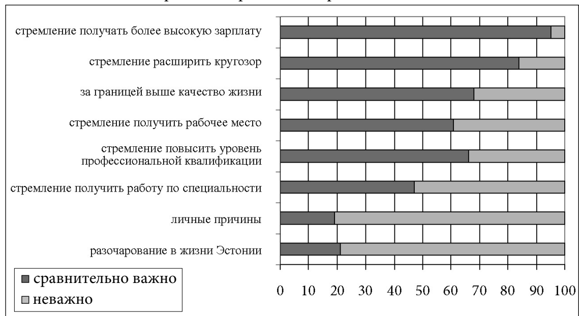
Причины передвижения рабочей силы