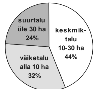
Talude jaotumine suuruse järgi 1920. aastatel

§ 21. Esimestena saavad maad: 1) kodanikud, kes Eesti vabastussõjas väerinnal iseäralikku vahvust on näidanud; 2) sõdurid, kes vabastussõja võitlustes vigastatud; 3) vabastussõjas langenud sõdurite perekonnad; 4) sõdurid, kes vabastussõjas tegevusest vaenlase vastu osa võtnud, silmas pidades tegevuse kestust.