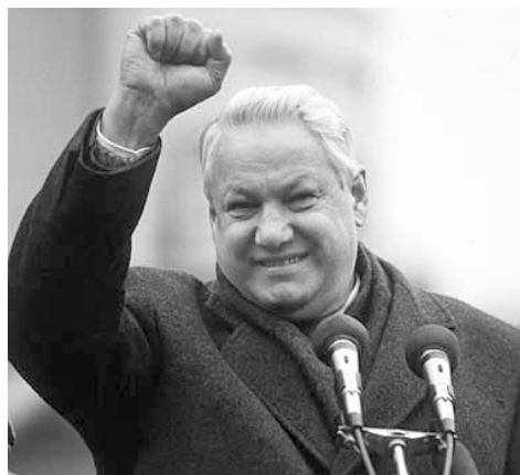
Борис Ельцин Президент Российской Федерации, по его инициативе был создан СНГ, после распада СССР Ельцин перенял от Горбачева «ядерный чемодан»

2. Кто из них в 1994 г. совместно с президентом Мери подписал договор о выводе российских войск из Эстонии? 1 б