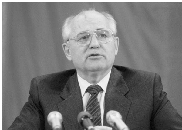
Михаил Горбачев Начало перестройки и гласности. Генеральный секретарь КПСС, Председатель Президиума Верховного Совета СССР, Президент СССР и т. д.

1. Кто изображен на photographs и в чем заключается их вклад в историю (должность или политическая деятельность)? 2 б (Имя и характеристика деятельности дает один балл)